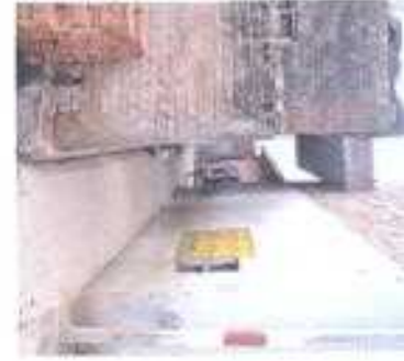
Gali No- 05.