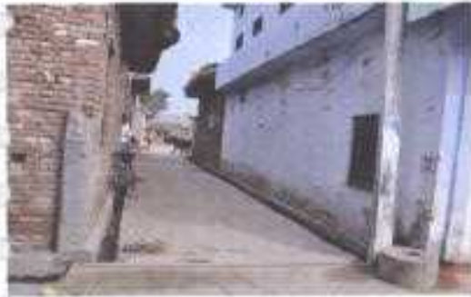
Gali No- 12.