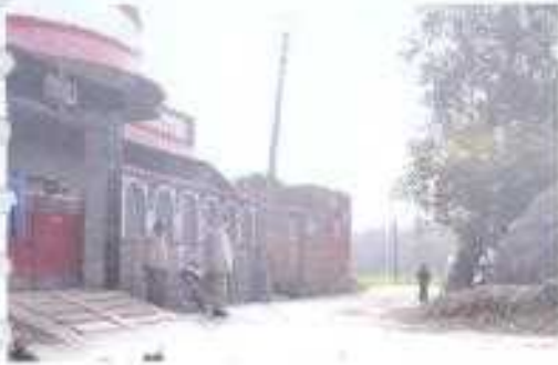
Gali No- 20.