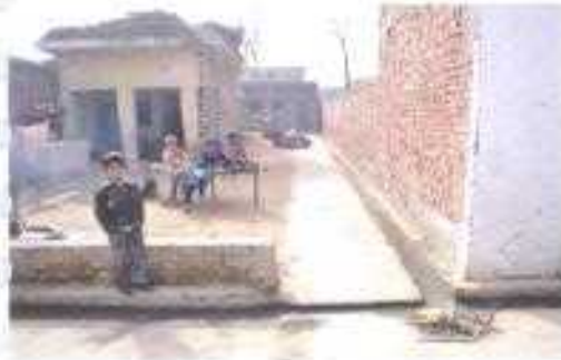
Gali No- 25.