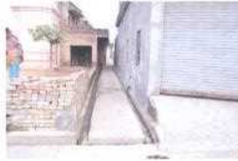
Gali No- 04 a.