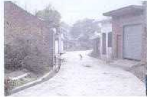
Gali No- 01.