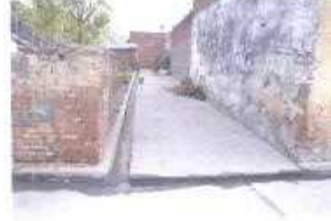
Gali No- 19.