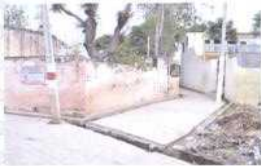
Gali No- 03.