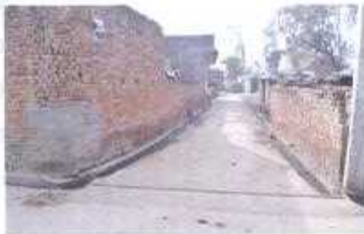
Gali No- 05 a.