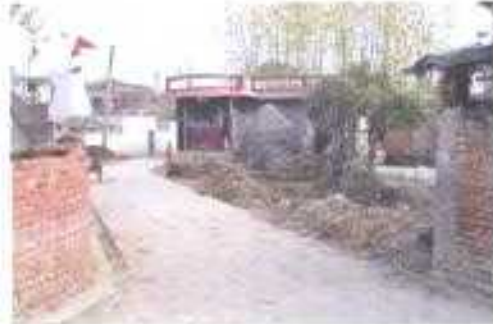
Gali No- 17..