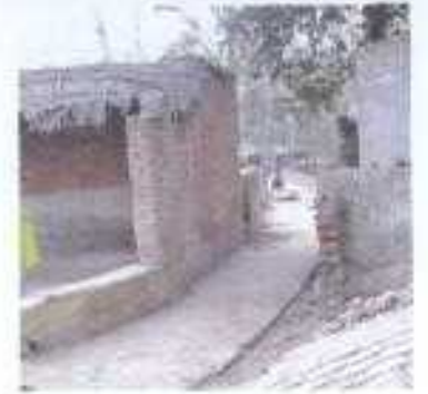
Gali No- 02.