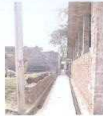
Gali No- 23