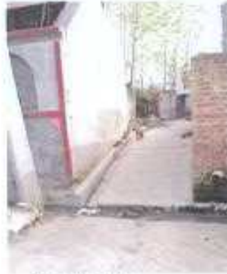
Gali No- 21