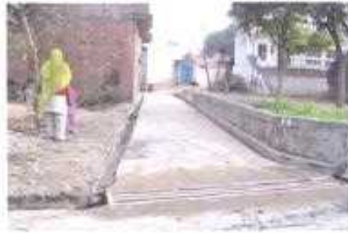
Gali No- 04.