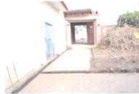
Gali No- 06.