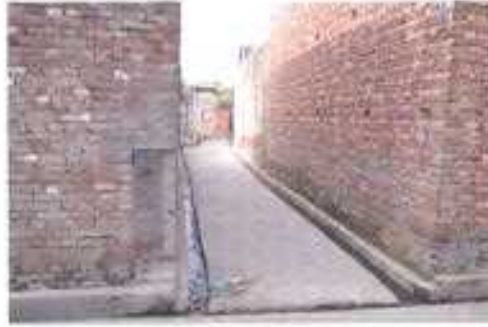
Gali No- 13..