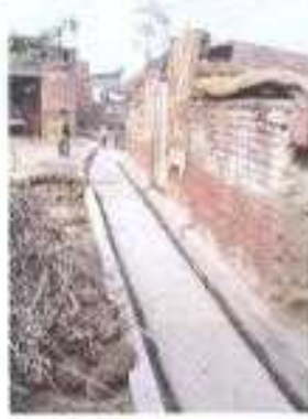
Gali No- 09..