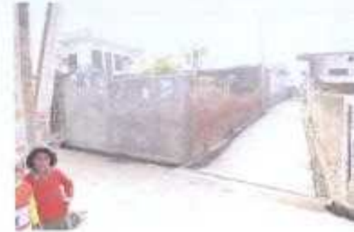
Gali No- 24