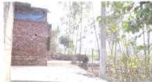
Gali No- 05 b.