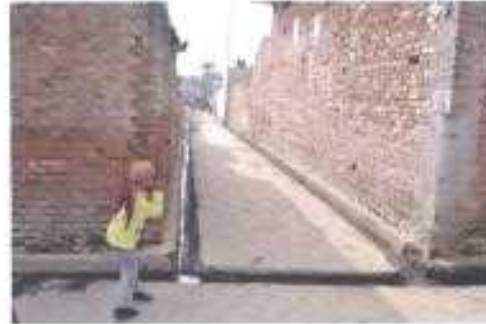
Gali No- 26.