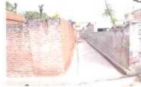
Gali No- 07.