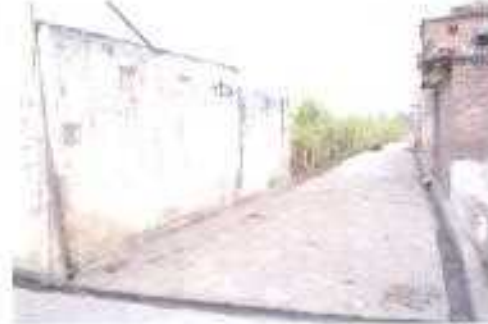
Gali No- 18.