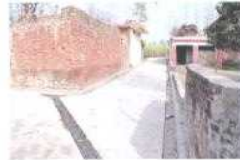
Gali No- 27.