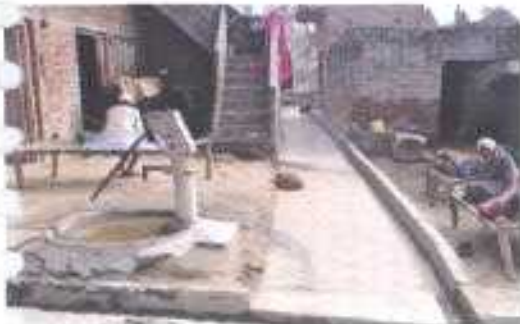
Gali No- 16