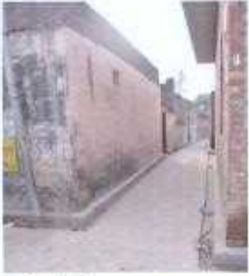
Gali No- 08.