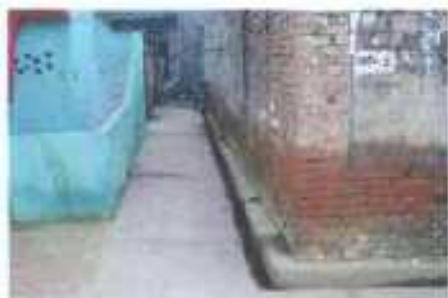
Gali No- 5