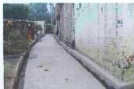
Gali No- 8