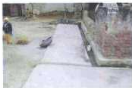
Gali No- 4