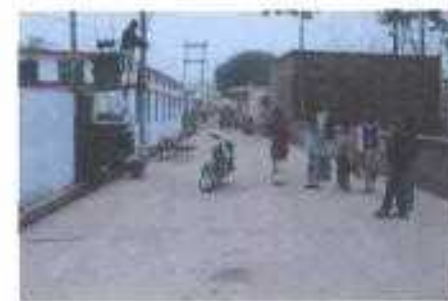
Gali No- 23