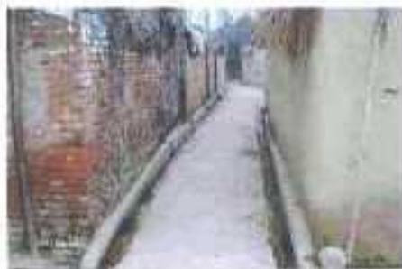
Gali No- 2