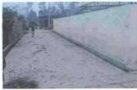
Gali No- 12