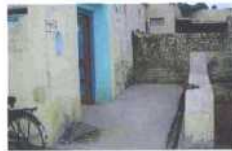
Gali No- 7