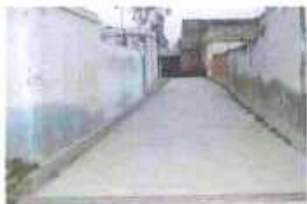
Gali No- 1