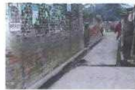
Gali No- 17