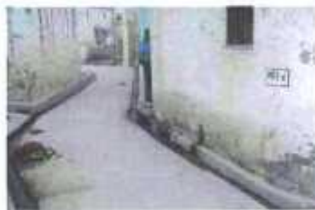
Gali No- 6