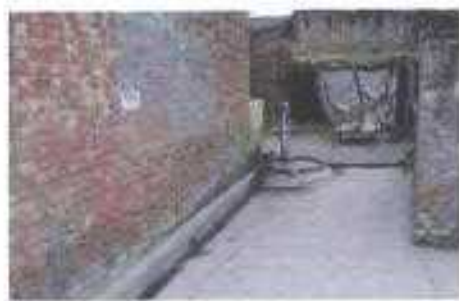
Gali No- 16